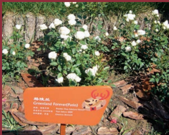
Ved det store nye Rosenmuseum i Beijing, Kina har de allerede plantet 'Greenland Forever' ud inden rosen faktisk er kommet til landet.