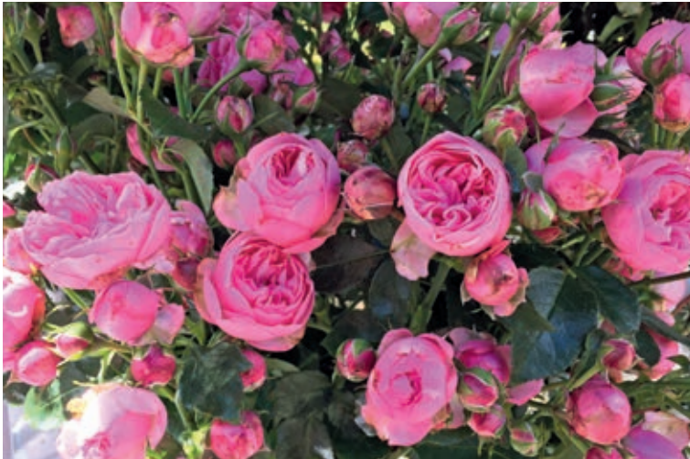
'Lise Nørgaard Rose' .