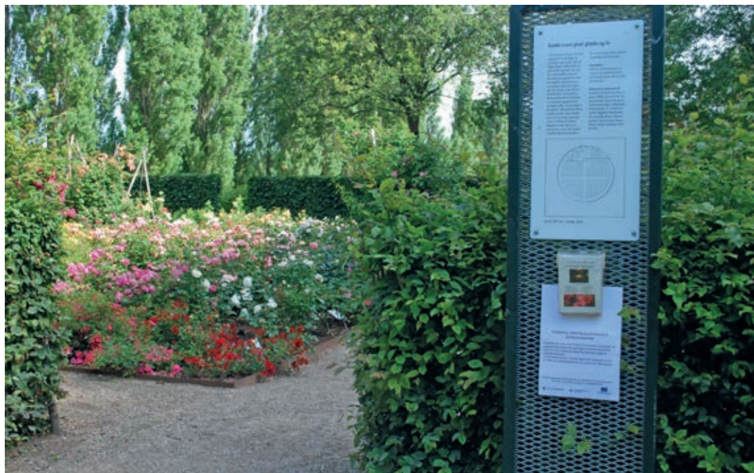
På en stander ved indgangen til haven kan man se en skitse over haven, og tage en folder med oversigt over roserne.