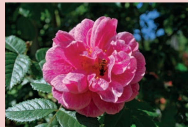
'Camelot' med svirreflue