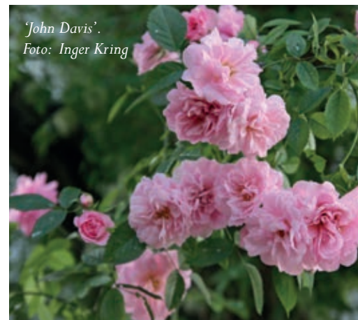
'John Davis'.

Frøplanter fra deres forædlingsprogram blev også sendt til havebrugsforsknings- og udviklingscentrene "L'Assomption" og "St.-Jean-sur-Richelieu" i Quebec, Canada. De kom også derfra i handlen, f.eks. 'Champlain', 'John Cabot', 'William Baffin', 'A. Mackenzie' og 'John Davis'. Den sidste, i 2007 udbudte rose i dette program, var 'Mme Claude Richer'.