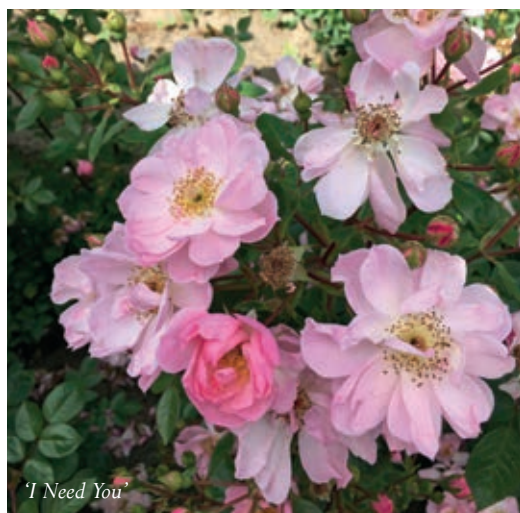
'I Need You'

føring. Vi så også roser, der skal bruges til dåb. Her er det en særlig udfordring dels at finde rosen, der passer til lejligheden, dels at opformere den i 1000 eksemplarer til salg hurtigt, efter at den er blevet døbt. Haven har også et særligt afsnit med frodige køkkenurter og et drivhus med vindruer. Vi så mange roser; her kan blandt andet nævnes 'Our Last Summer' som kla-