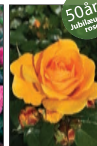
Friendship Forever™ Buketrose