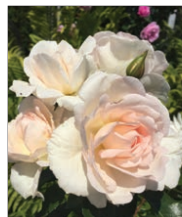
Inger Forever™ Buketrose Rigt blomstrende buskrose med skøn duft

♥ Tre vidunderlige duftende skønheder - alle navngivet af Ghita Nørby ♥