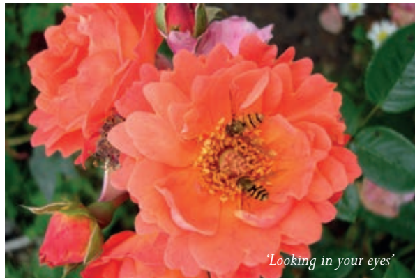
'Looking in your eyes'