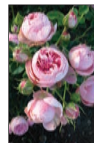
She loves you™ Buketrose

RosenNyt hjælper gerne med layout og opsætning.