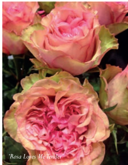
'Rosa Loves Me Tender'