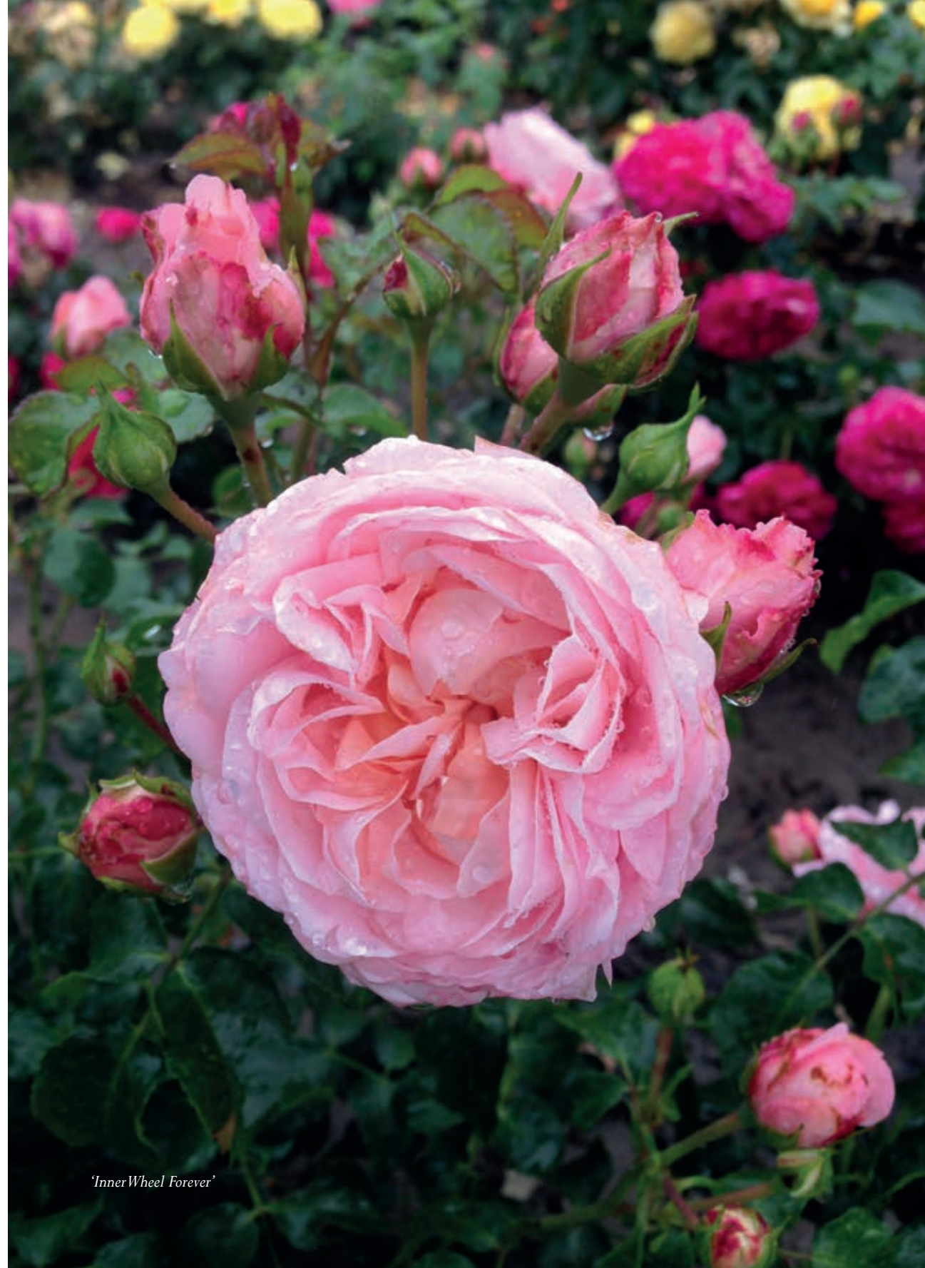
'Inner Wheel Forever'

ROSA - forædleren Forlaget Centifolia, 2016 Forfatter: Torben Thim 170 sider