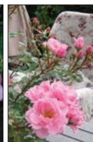
I need you™ Bunddækkende rose