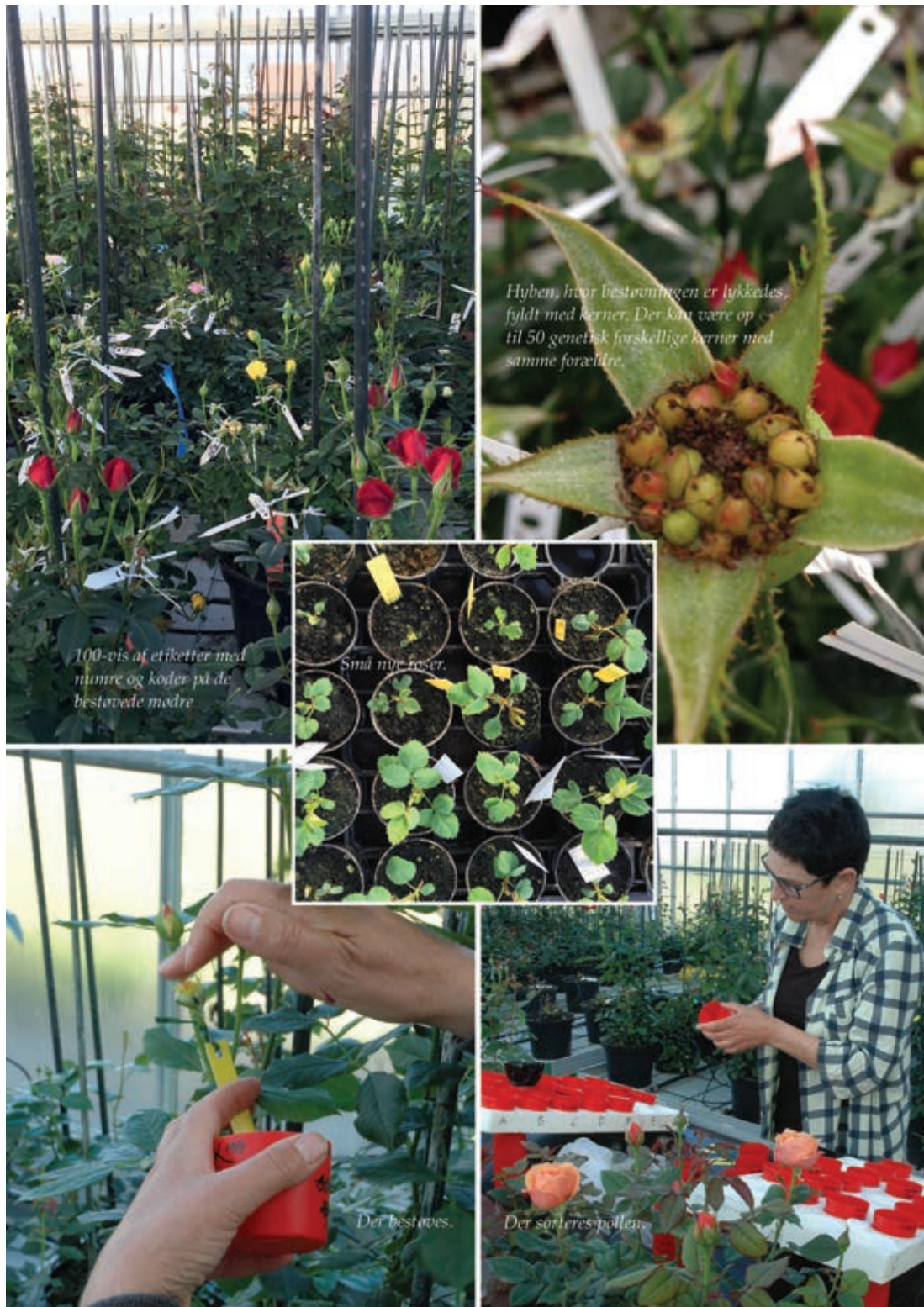
Hyben, hvor befrugtningen er lykkedes, fyldt med kerner. Der kan være op til 50 genetisk forskellige kerner med samme forældre.