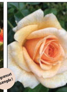
Elin's Rose™ Buketrose