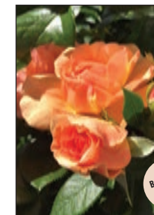
Prins Henrik™ Buketrose