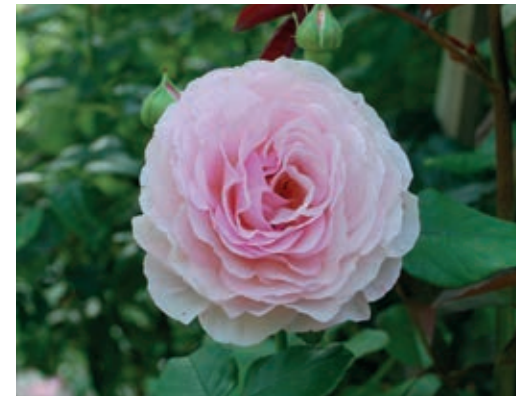
'James Galway' - en af de 80 rosensorter i haven