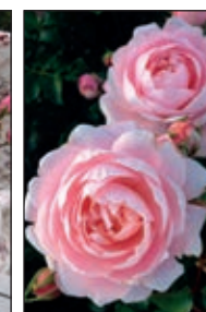
Inner Wheel Forever™ Buketrose