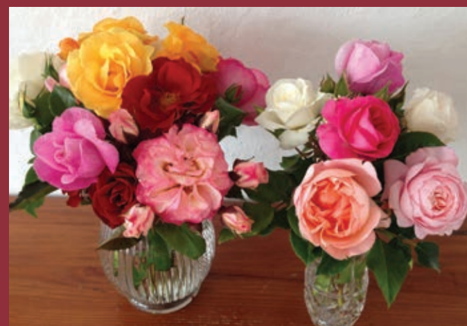
Testbedet står i fuld flor. Så kan der noteres og skæres buketter. Selv når roserne står så tæt, er det muligt at se, hvad der adskiller dem på hårdforhed, skønhed og modstandskraft over for sygdomme