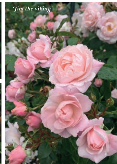
'Jim the viking'