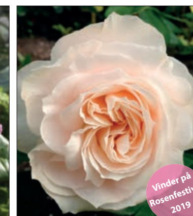
Fru Nørby™ Buketrose Store blomster med vidunderlig duft