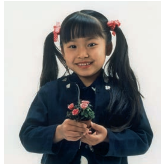
'Pinocchio' er et navn i en serie af Verdens mindste roser. Japanerne elsker disse mini-mini'er og har fået "license to grow"

For knapt femtusind år siden plantede urtegårdsmænd de første roser i Kinas haver. De fandt roserne i deres egen egn, omplantede dem, passede og plejede dem. Hermed var "forædlingen" sat i gang. Men hvad er forædling af planter?