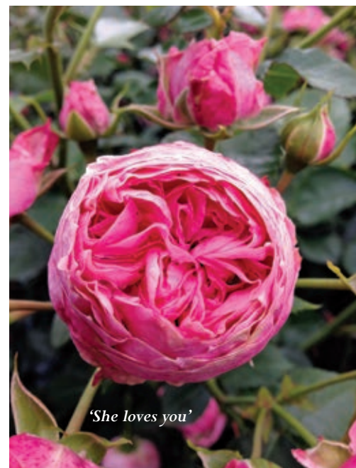
'She loves you'