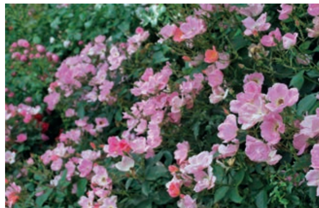
'Rainbow Knock Out'

vådt år i 2017 til ekstrem tørke og varme i 2018, mens 2019 bød på eftervirkninger af vandunderskud fra 2018 og efterfølgende nedbør. Man kan derfor sige, at roserne har vist deres værd under flere forskellige vejrforhold. Resultaterne af vurderingerne er endnu ikke færdigbearbejdede (kan rekvireres på mail fra juch@hortiadvise.dk ).