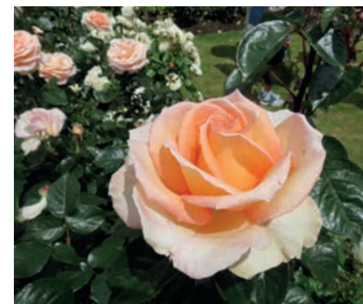
'Hamilton Gardens "synonym" - 'Always Remember Me'