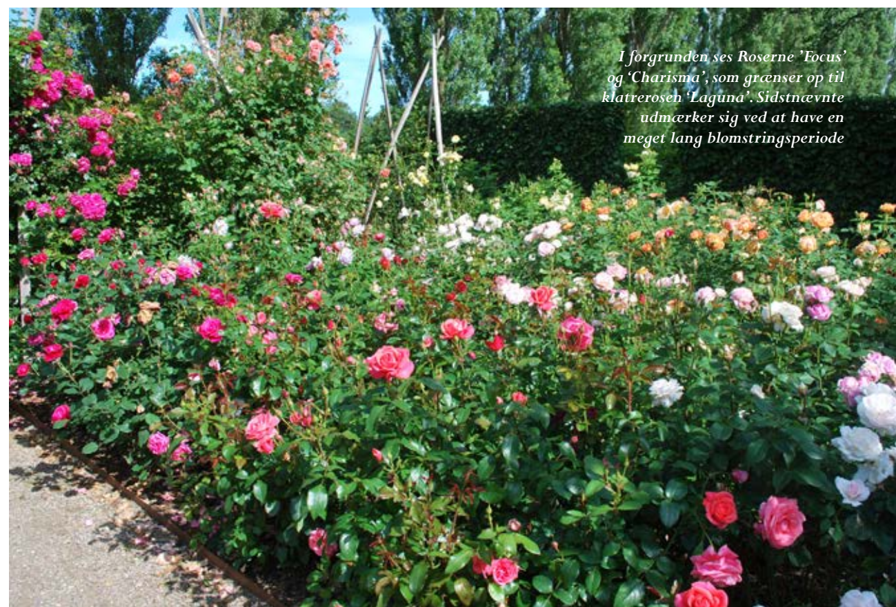
I forgrunden ses Roserne 'Focus' og 'Charisma', som grænser op til klatrerose 'Laguna'. Sidstnævnte udmærker sig ved at have en meget lang blomstringsperiode

Rosensorterne er et bredt udvalg af mange forskellige sorter, både kendte sorter, men også sorter, som på tidspunktet for udvælgelse var nyere sorter fra forældre. I temahaven dyrkes roserne uden brug af pesticider. Der er således mulighed for at se roserne, og se hvordan de klarer sig samt selv vurdere dem.