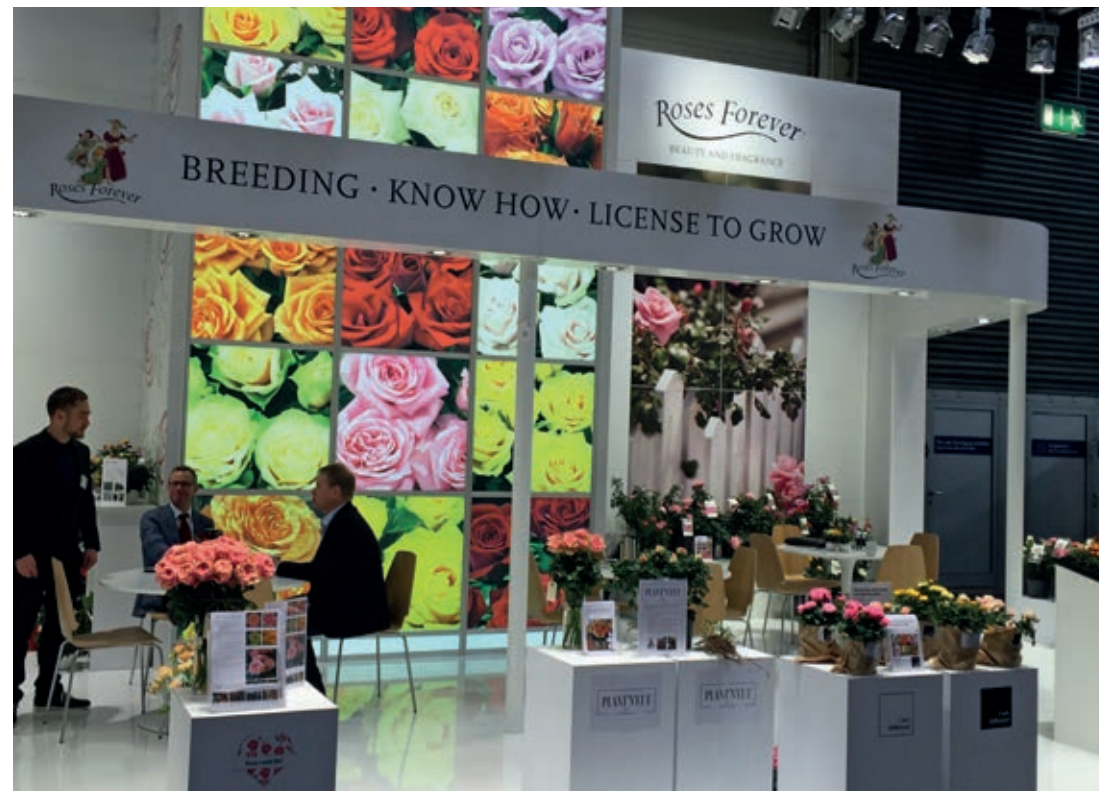
Rosen gennemgår mange håndteringer, forvandlinger og processer før den kan vises for offentligheden. Her er Rosas stand i 2016, på verdens største plantemesse IPM i Essen i Tyskland. Minimalistisk med sans for det væsentlige: præsentation af farver. Minirosen som den pakkes og minirosen som den anvendes.

Og man valgte den smukkeste blomst blandt de mange frøplanter og avlede igen på den ved at udså dens frø eller bruge materiale fra planten, stiklinger eller rodskud, til at producere flere planter. Havde man mange roser på et sted ville flere af dem måske have bestøvet hinanden og der åbenbarede nye sorter ved udsæd.