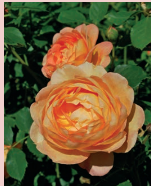
'Lady of Shalott'