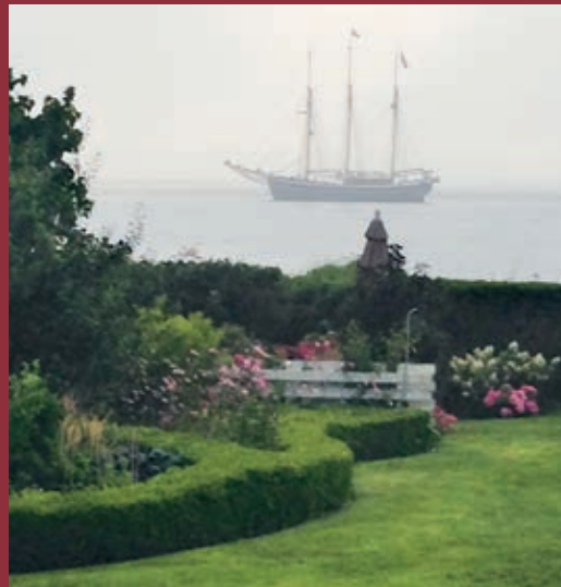
Fuldrigger for anker mellem Rosas strand, hvor svanerne lander om efteråret, og smuglerøen Bjørnø

Det hårde arbejde lønner sig. Ønskerne skal opfyldes og få måneder efter såning står Rosa i et hav af blom-