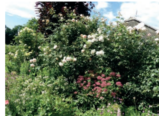
Et overdådigt bed i Troensehaven

Det er en på alle måder inspirerende have. Ved det første kig fra gården ned gennem haven fik man indtryk af, at der var planter overalt – men når man så bevægede sig gennem haven på brede og smalle græsstier, ja så åbnede der sig det ene spændende bed efter det andet - nogle organisk formede, andre med strenge linjer. Hvert bed i sine farver med roser, stauder, urter, buske og træer. Der bliver leget med farverne som tone i tone, men også med komplementærfarver. I hvert bed er der noget at se på hele året: Blomster fra forår til efterår og stedsegrønt om vinteren. Bagest i haven, helt omhegnet af