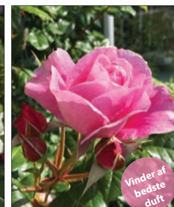
Our Last Summer™ Klatrrose Velduftende store blomster