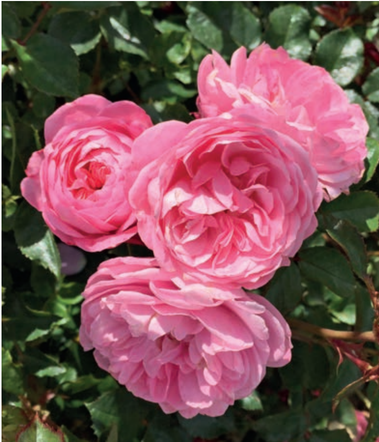
'Cph Garden in Bloom' . Foto: Roses Forever

Forside: 'Rosa Loves Me With Heart And Soul' . Foto: Roses Forever