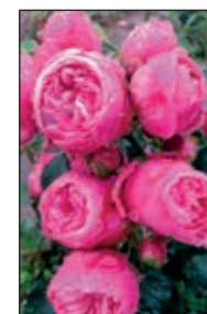
Lise Nørgaard™ Buketrose