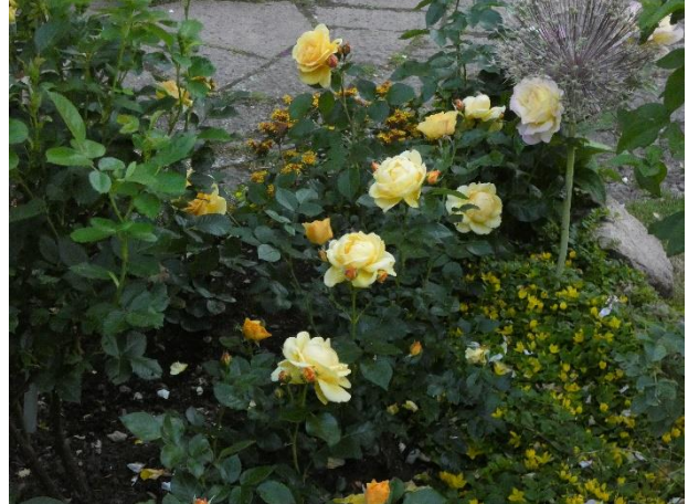
'Friendship Forever' i sammenplantning d. 11. 07. 2020

'Friendship Forever' blev også valgt til velgørenhedsrose. Det indebærer, at for hver rose Roses Forever sælger, går 1 dansk krone til WFRS (World Federation of Rose Societies).