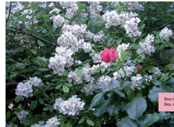
Rosa multiflora