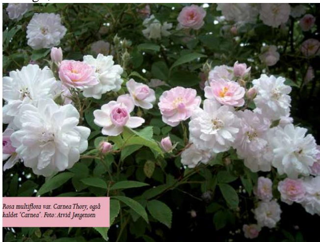
Rosa multiflora var. Carnea Thory, også kaldet 'Carnea'.

Det er ganske pudsigt at tænke på, at det var en kirurg og en ingeniør, som stod bag multifloraernes ankomst til Europa. Lad os se lidt på kirurgens bidrag først.