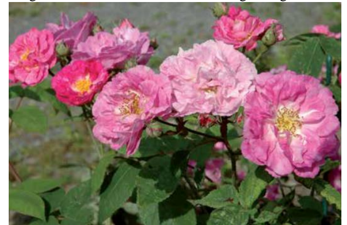
'De la Grifferaie'

‘ De la Grifferai ’ adskiller sig fra mange af de andre roser i gruppen, ved at den har større (op til 8 cm) fyldte og flade kirsebærrosa blomster, som blegner via lysrosa chatteringer henimod hvidt, efterhånden som de falmer. De flade blomster, som vokser i luftige klaser på 5-15 stk., er noget, vi kan genkende fra gallica-roserne. Duften er middel og sødlig.