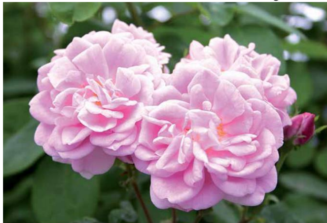
Geschwinds Nordlandrose I'

Multifloraerne vokser godt på egen rod og er blandt de sorter, som er lettest at formere ved stiklinger.