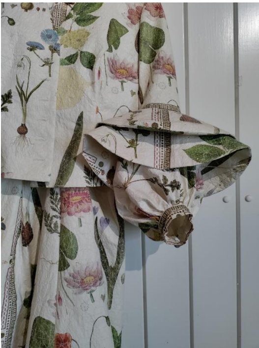
[Ghitas papirkjole Flora Danica]

Der kom rådgivningsopgaver for Rangle Mølle, Falkenhøj Gods, Rysensteen ved Lemvig, og Styrelsen for Slotte og Kulturejendomme fik bistand til anlæggelse af Dronning Louises Rosenhave ved Bernstorff Slot. Der er blevet tegnet anlæg til Odense ZOO, Valbyparken, Tusculum ved Kgs. Lyngby, og senest Rosendal Slott ved Helsingborg i Sverige.