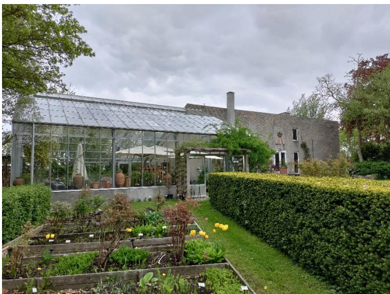
[Havevandring i Løve]