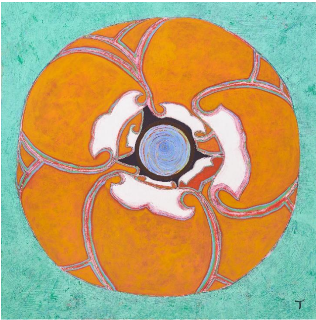
[Torben Thim: – ROSA, acryl på lærred, 200x200 cm, 2019]