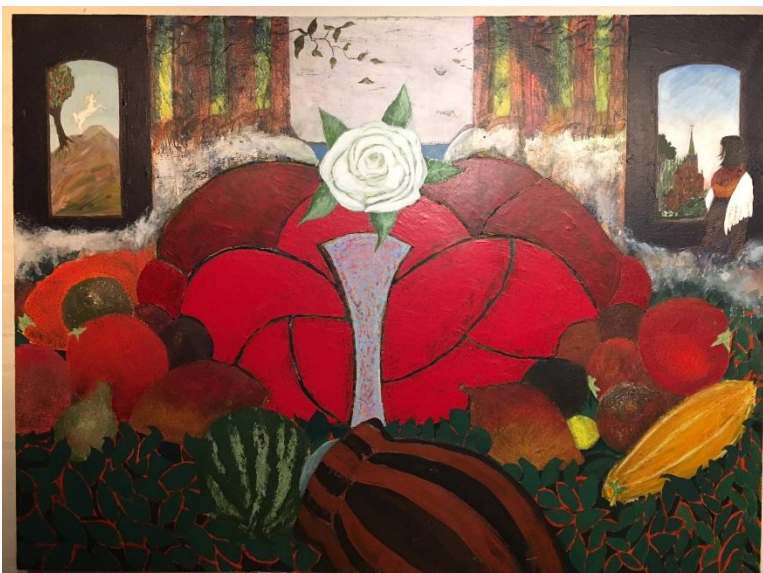
[Torben Thim - En elskede er på vej, 2020, pressefoto]